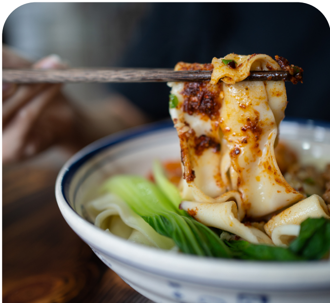
精心設計的沉浸式文化體驗

入住時尚、舒適和交通便利的五星級酒店—金輝鉑爾曼酒店或同級酒店，讓你輕鬆探索西安。