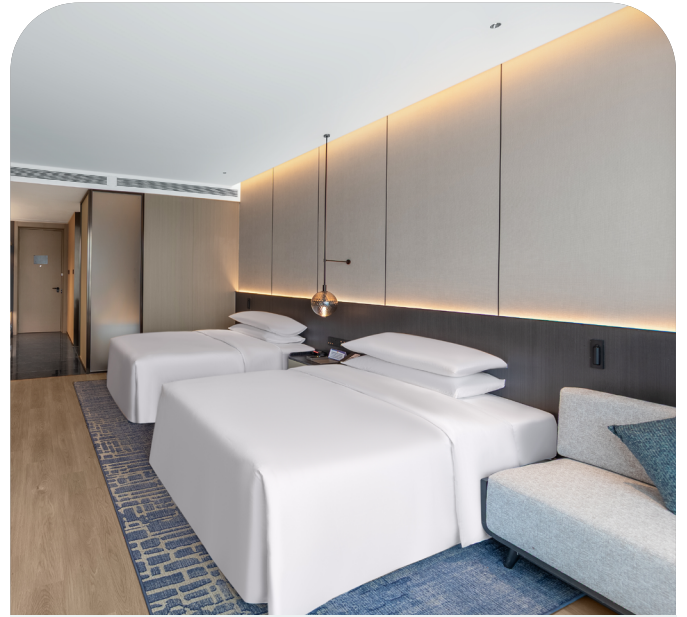
精選高級西安市區酒店

入住時尚、舒適和交通便利的五星級酒店—金輝鉑爾曼酒店或同級酒店，讓你輕鬆探索西安。