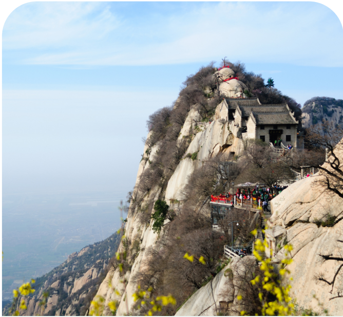
從西安文化遺產到山岳風光