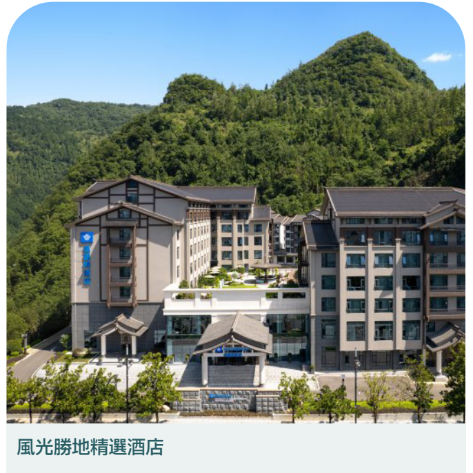
風光勝地精選酒店

旅程橫跨張家界壯麗山水、鳳凰古城歷史風貌及長沙城市活力，展現自然與文化交融的多元魅力。