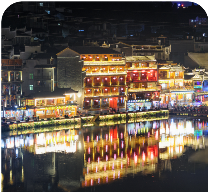
精心設計的沉浸式文化體驗

透過多元沉浸式體驗，從民族表演與傳統服飾體驗，到VR及航拍體驗，締造難忘的長沙之旅。