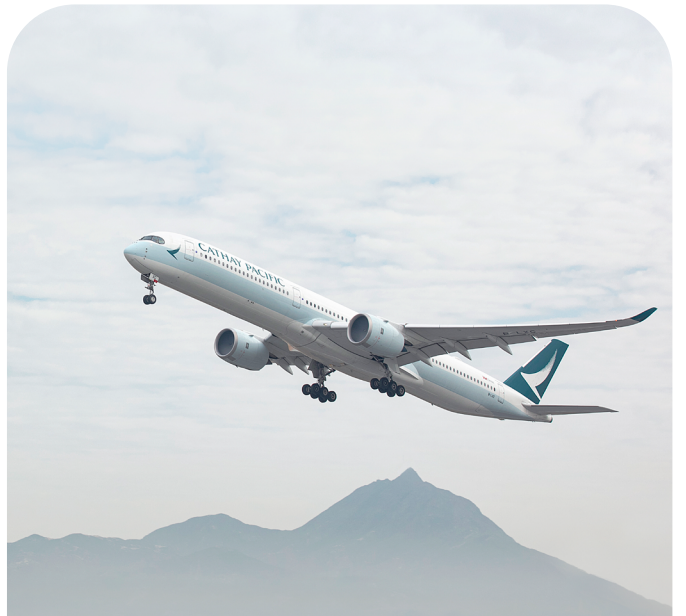
輕鬆無憂的旅程安排

透過多元沉浸式體驗，從民族表演與傳統服飾體驗，到VR及航拍體驗，締造難忘的長沙之旅。