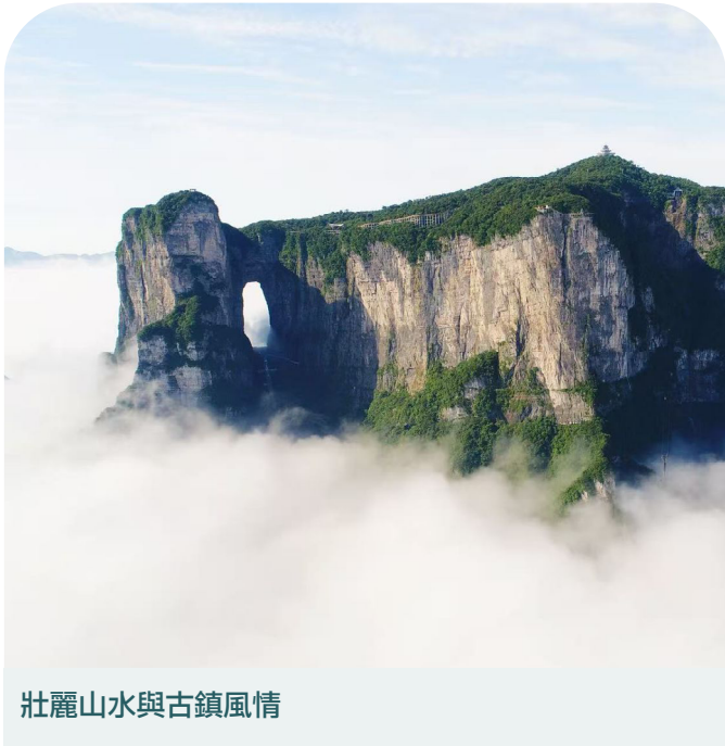
壯麗山水與古鎮風情

旅程橫跨張家界壯麗山水、鳳凰古城歷史風貌及長沙城市活力，展現自然與文化交融的多元魅力。